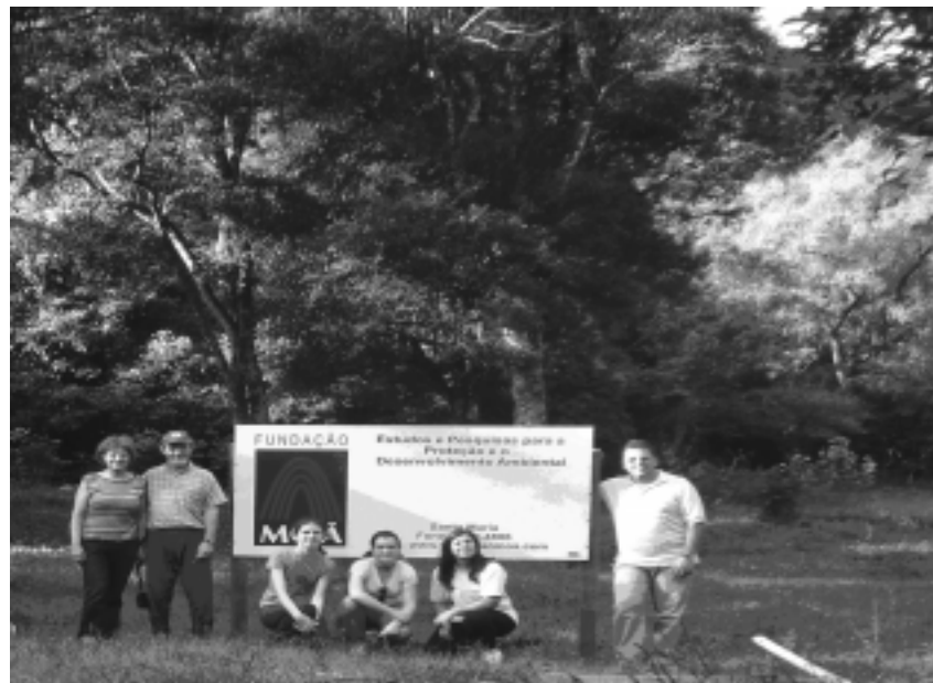
A foto mostra Professores e alunos no local quando da colocação da placa.cooperação científica, educativa, tecnológica e cultural entre seus membros.

A Fundação MO'Ã – Estudos e Pesquisas para a Proteção e Desenvolvimento Ambiental – participou deste evento a convite. A Fundação recebe apoio para sua futura RPPN (área de 24 hectares escriturada), localizada no "Rincão dos Minelos" no Município de Itaara/RS e que se encontra em fase de regularização física. Pela propriedade passa o Arroio Manoel Alves importante manancial hídrico do Município e já com alguns trabalhos acadêmicos produzidos por estagiários da Fundação e orientados por Professores do Departamento de Geociências do Curso de Geografia da UFSM.